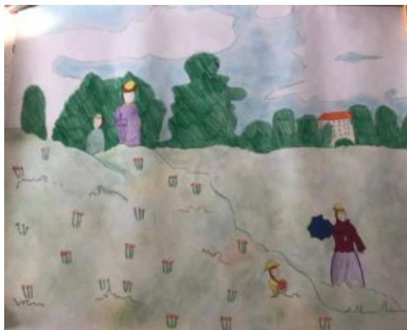
disegno di Matilde Gallo, anni 10